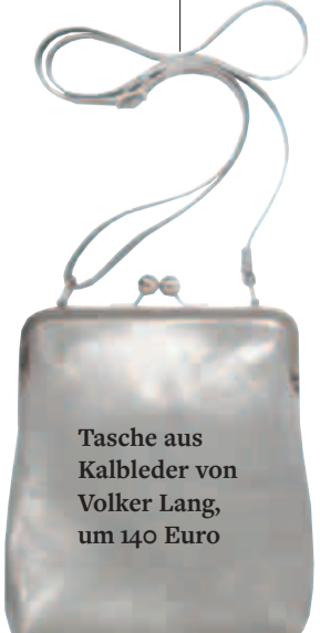
Tasche aus Kalbleder von Volker Lang, um 140 Euro