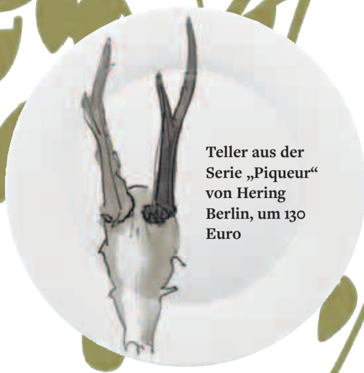
Teller aus der Serie „Piqueur“ von Hering Berlin, um 130 Euro