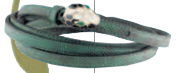
Gürtel mit Schlangenkopf aus Emaille und Malachit von Bulgari, um 420 Euro