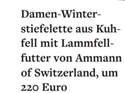
Damen-Winterstiefelette aus Kuhfell mit Lammfellfutter von Ammann of Switzerland, um 220 Euro