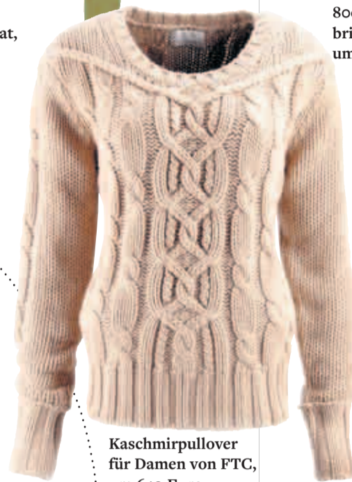
Kaschmirpullover für Damen von FTC, um 640 Euro