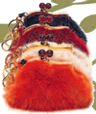
Mini-Geldbeutel als Schlüsselanhänger von Miu Miu, um 495 Euro