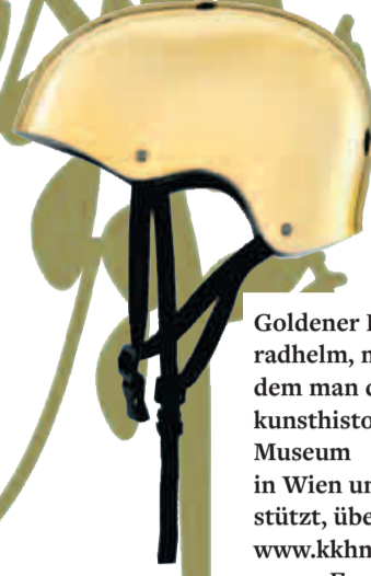
Goldener Fahrradhelm, mit dem man das kunsthistorische Museum in Wien unterstützt, über www.kkhm.at, um 50 Euro