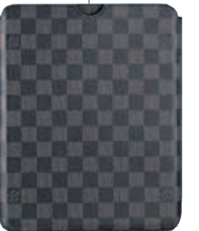
iPad-Hülle von Louis Vuitton, um 285 Euro