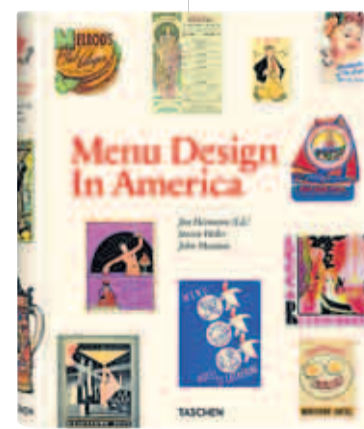
„Menu Design in America“, Taschen Verlag, 39,99 Euro