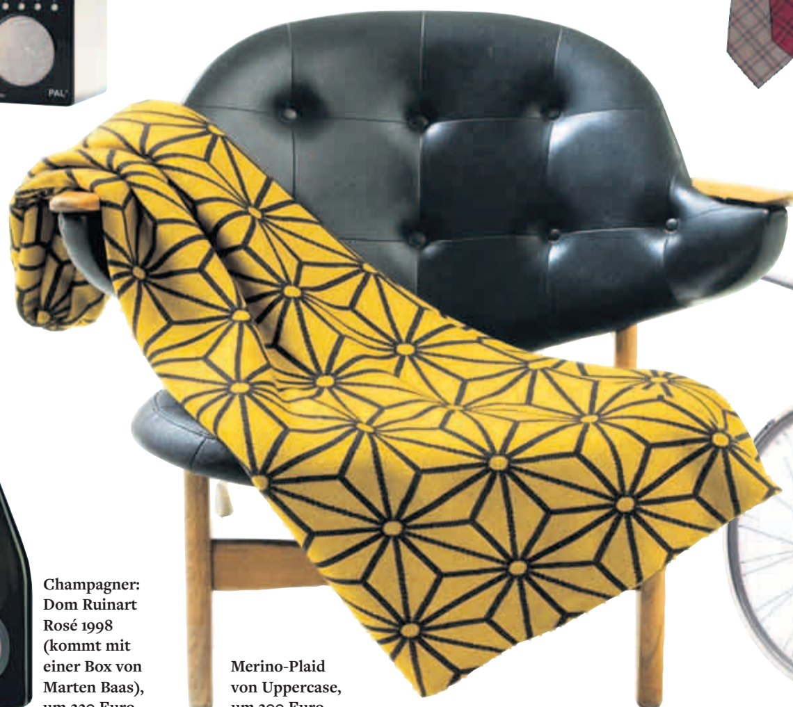
Merino-Plaid von Uppercase, um 300 Euro