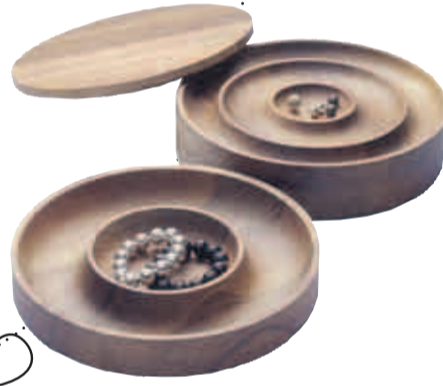
Schmuckbehälter aus Nussbaum von Saskia Diez für €15, um 580 Euro