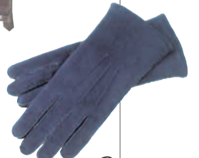
Lammfellhandschuhe von Roeckl, um 130 Euro