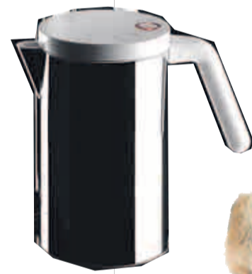
Wasserkocher „hot.it“ von Alessi, um 90 Euro