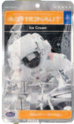
Astronauten-eiscreme, um 4 Euro, über amazon.de