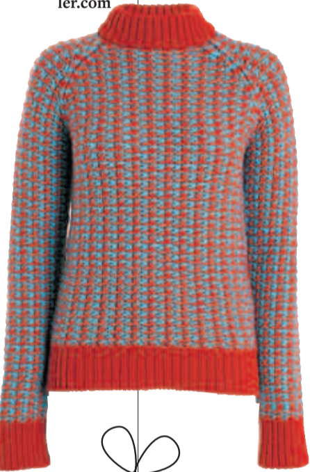
Kaschmirpulli von Jil Sander, um 730 Euro, über maendler.com