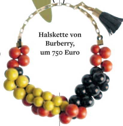
Halskette von Burberry, um 750 Euro