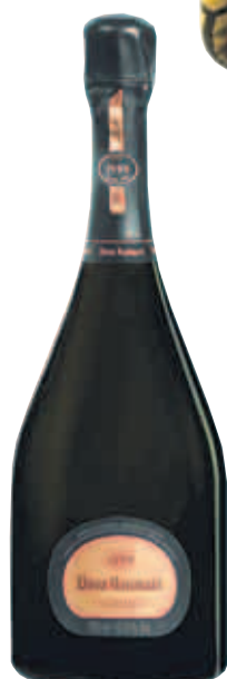
Champagner: Dom Ruinart Rosé 1998 (kommt mit einer Box von Marten Baas), um 230 Euro