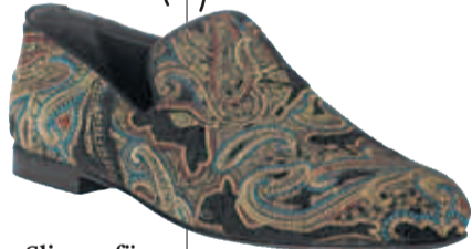
Paisley-Slipper für Herren von Jimmy Choo, um 550 Euro