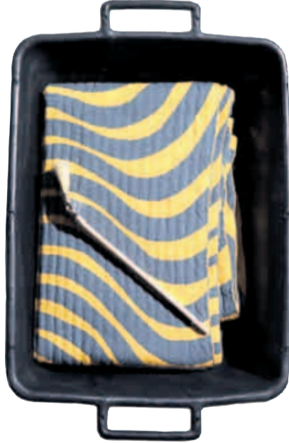
Kaschmirplaid von Atipico, ab 280 Euro