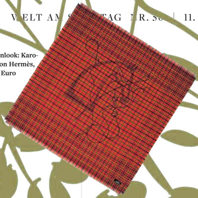
Schottenlook: Karo-Carré von Hermès, um 360 Euro