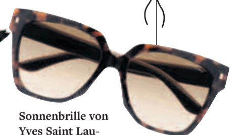
Sonnenbrille von Yves Saint Laurent, um 200 Euro