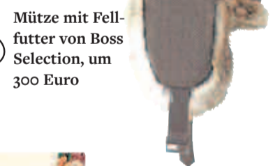
Mütze mit Fellfutter von Boss Selection, um 300 Euro