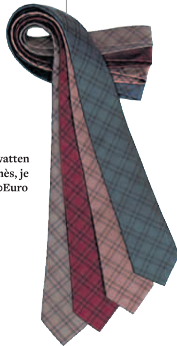
Krawatten von Hermès, je um 140 Euro