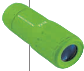
Taschenfernglas von Brunton, um 24 Euro

Folge 3 unserer vierteiligen Serie: Geschenkideen für Frauen und Männer, Mütter und Väter, Freundinnen und Freunde